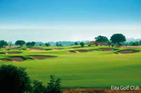
Eléa Golf Club