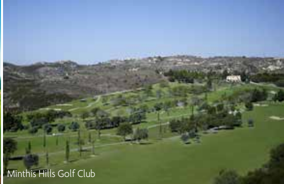
Minthis Hills Golf Club