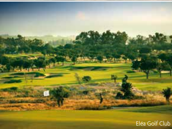
Eléa Golf Club